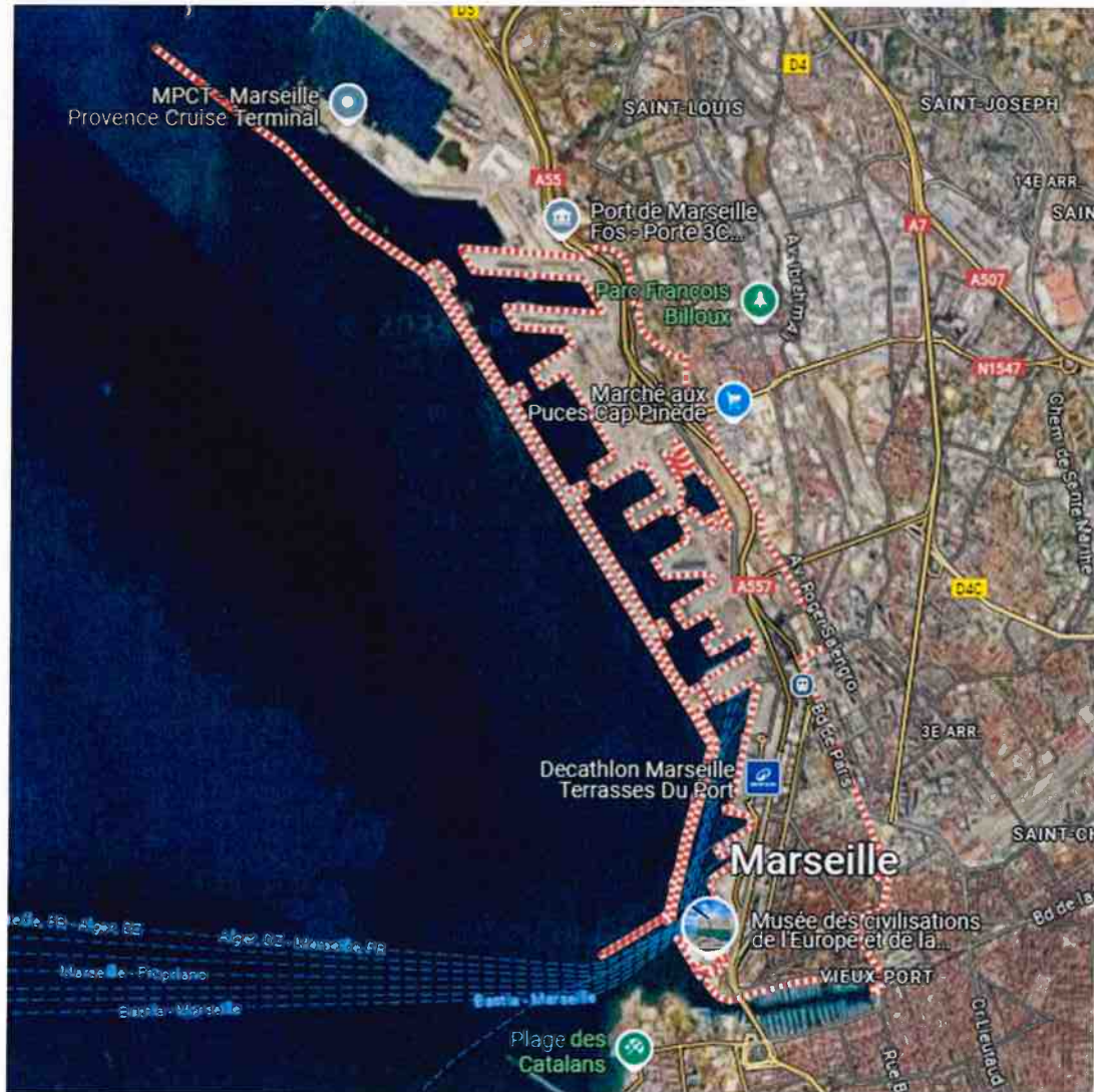
Figure 1. Plan de situation, 2e arrondissement