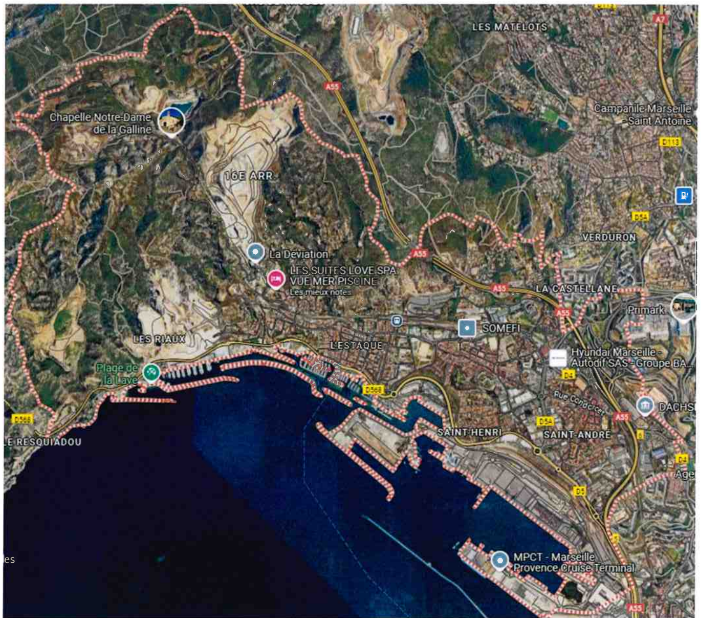
Figure 4. Plan de situation, 16e arrondissement