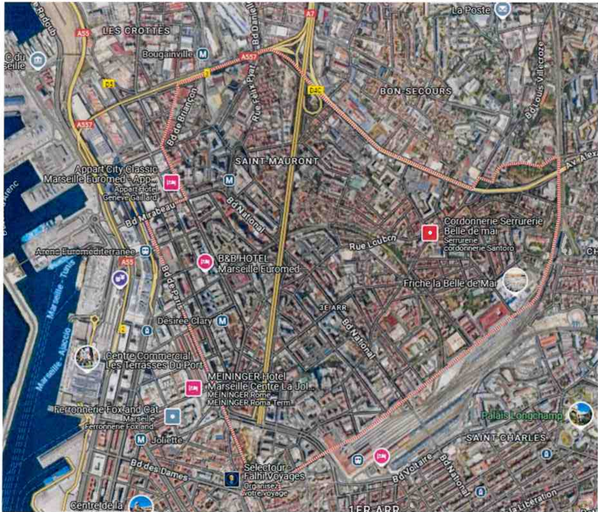
Figure 2. Plan de situation, 3e arrondissement