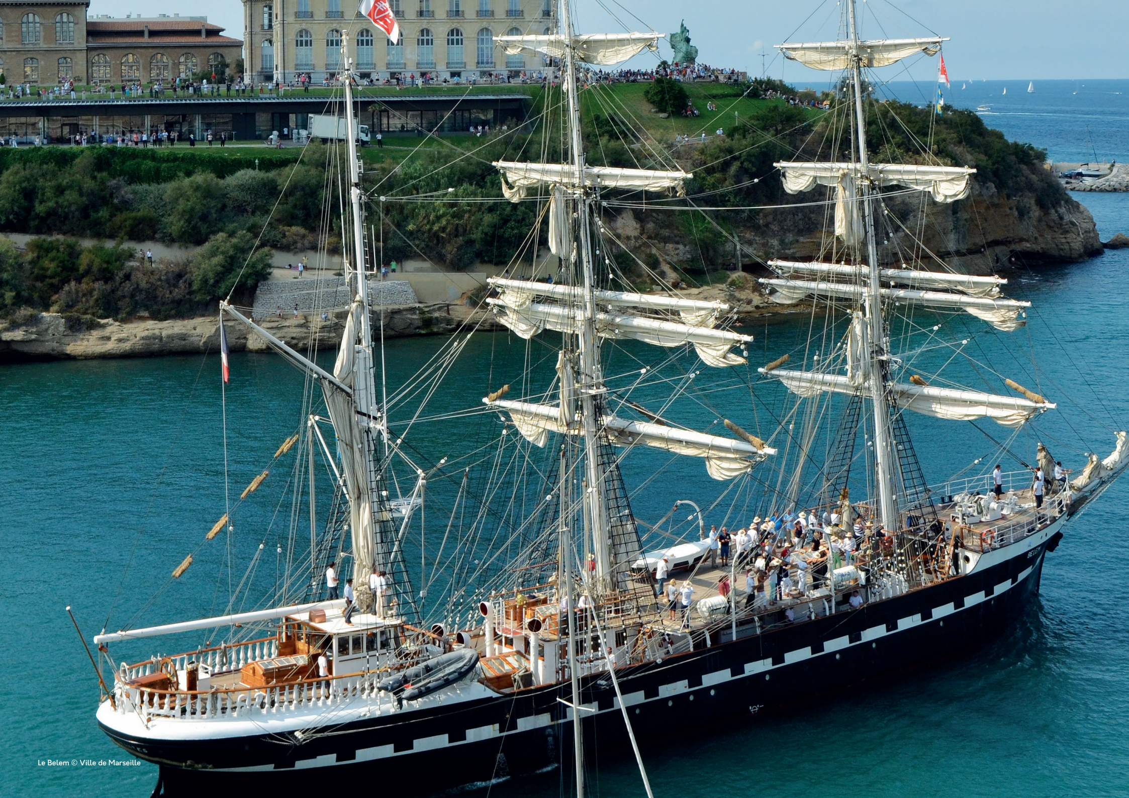
Le Belem