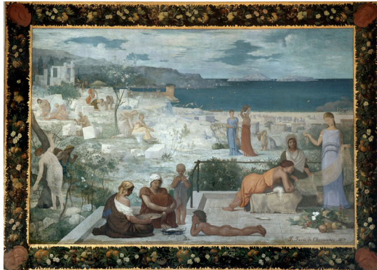
Pierre Puvis de Chavannes Marseille, colonie grecque, 1869 Huile sur toile marouflée sur le mur Commande de la Ville de Marseille à l'artiste en 1867