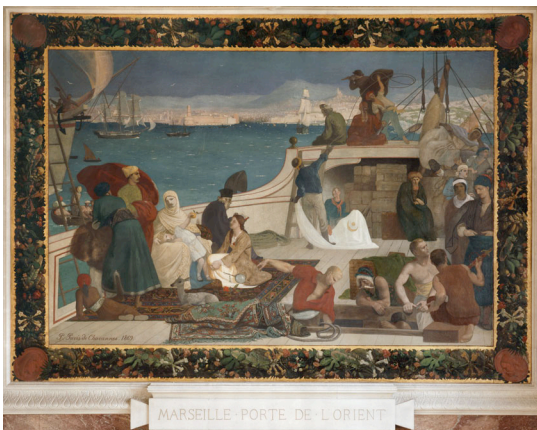
Pierre Puvis de Chavannes Marseille porte de l'Orient, 1869 Huile sur toile marouflée sur le mur Commande de la Ville de Marseille à l'artiste en 1867