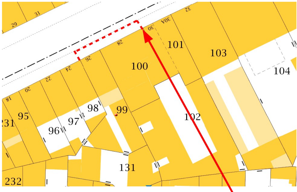
Périmètre de sécurité interdisant le trottoir

Périmètre de sécurité interdisant le trottoir sur sa largeur en gardant un passage d'un mètre pour les passants le long de la façade des immeubles sis 26 et 28 boulevard de la Libération.