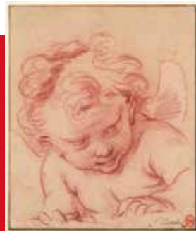
L'Amour espègle - F. Boucher - Milieu du XVIII e siècle