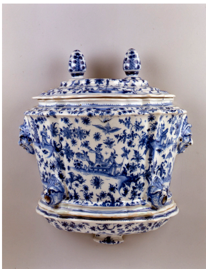
Fontaine d'applique

Le sujet du travail de Robin Best est l'Histoire, et, pour les vases « Watling » particulièrement, l'histoire du commerce européen avec l'Asie et le Nouveau Monde, aux XVII e et XVIII e siècles. Son intérêt se porte sur les découvertes scientifiques de cette époque et les liens interculturels entre ces pays. Les vases s'inspirent des planches de Thomas Watling, peintre et illustrateur, né en 1762 en Écosse et déporté à Sydney en 1792 dans la toute nouvelle colonie établie en Nouvelle-Galles du Sud. Gracié en 1797, il va peindre de nombreuses scènes de la vie quotidienne des habitants, s'attachant également à la description fidèle d'oiseaux, d'animaux et de plantes. Les images retracent l'arrivée de la première flotte de colons à Sydney et les activités d'« indigènes » pêchant et cuisinant. Une grande variété d'animaux et de fleurs - cacatoès à huppe, martin-pêcheur, kangourou, fleur de gomme - rappelle la fascination des premiers colons pour la faune et la flore de ces contrées nouvelles. Robin Best a su en capter l'essence, entre admiration pour les scientifiques et les botanistes qui ont rapporté ces témoignages en Europe et dénonciation de la colonisation et de la mondialisation en marche.