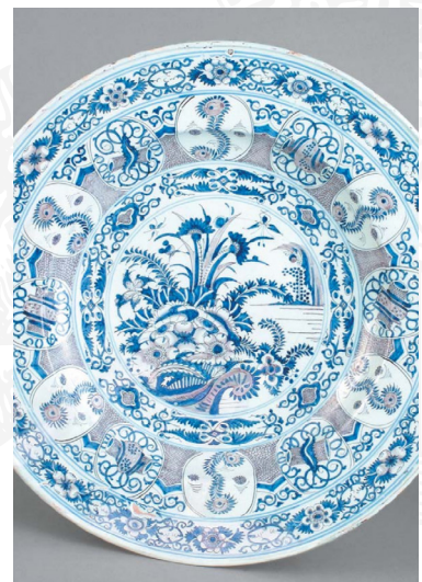
Plat de Sèvres