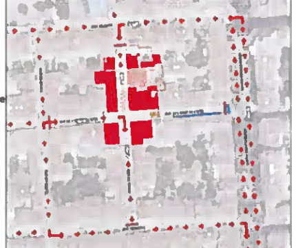
Schéma de circulation du quartier

Responsabilité des clés transférée au Syndic d'immeuble